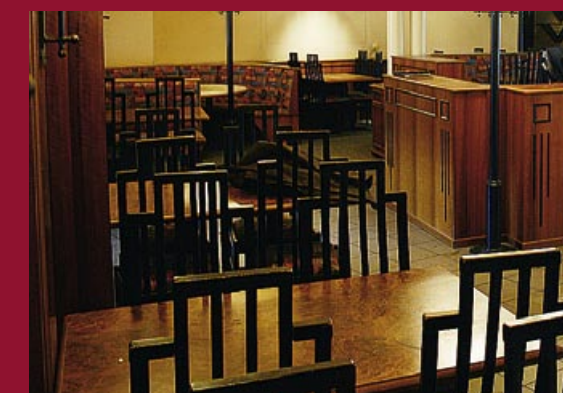
Das ehemalige Lokal „Kreta“

Das neue Restaurant besticht durch ein cleveres Raumkonzept und den Einsatz hochwertiger Materialien.