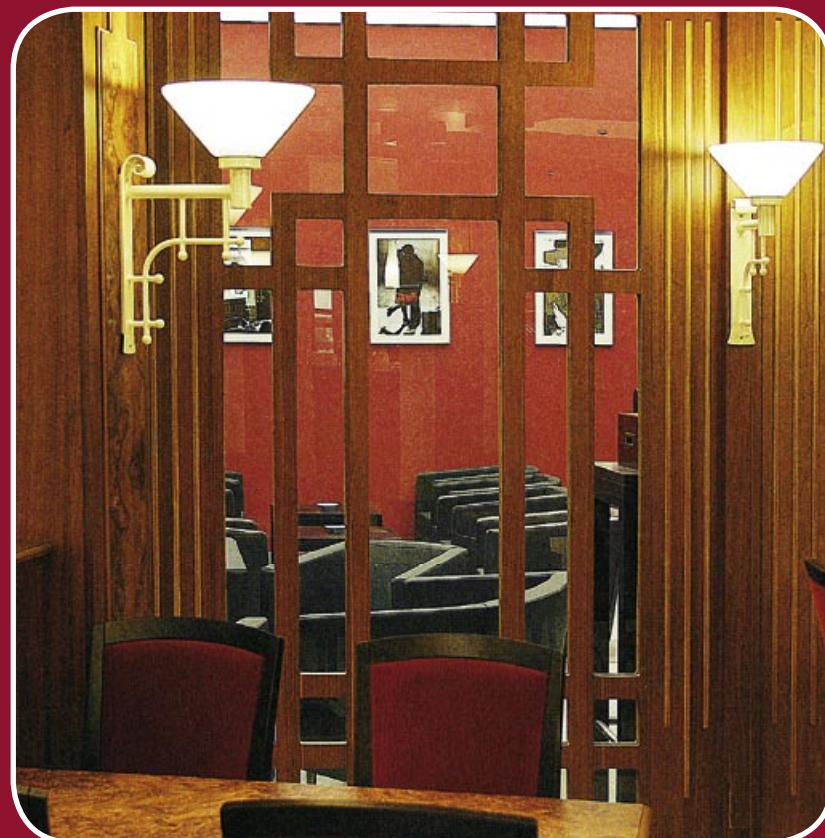
Warme Farben, geschmackvolles Ambiente: Restaurant und Lounge im sento.

Pforzheim darf sich freuen: In der Rekord verdächtigen Zeit von nur 63 Tagen hat die Bohner & Boos GmbH in den Räumlichkeiten des ehemaligen Lokals „Kreta“ ein neues Gastro-Konzept umgesetzt. Mit dem sento bietet die Zehnthofstraße 14 ab sofort drei Locations unter einem Dach: Restaurant, Bar und stilvolle Lounge. Neueröffnung ist am 2. März.