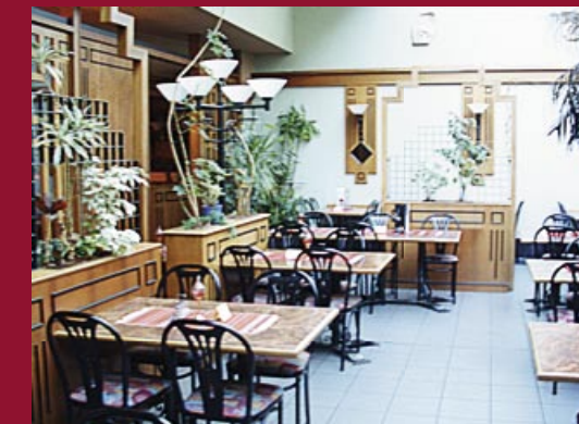
Das ehemalige Lokal „Kreta“

Vom ersten CAD-Entwurf bis zum komplett neuen Interior-Design vergingen gerade einmal 63 Tage.