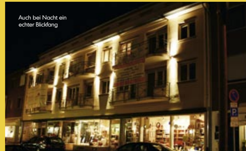
Auch bei Nacht ein echter Blickfang

Die Dillsteiner Straße in Pforzheim hat ein neues Schmuckstück