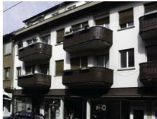
Das Gebäude vor der Sanierung

Dies zählt sich nun für alle Beteiligten aus: denn bereits kurz nach dem Startschuss für die Vermietung des Objekts durch die Immobilien Depot GmbH in Pforzheim konnten bereits 6 der insgesamt 9 zur Vermietung stehenden Wohnungen im Vordergebäude vermietet werden.