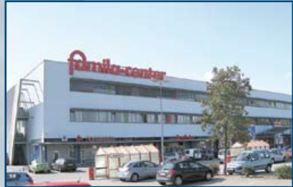
famila Center Frankenthal