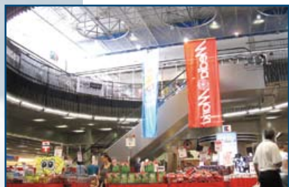
famila Center Heidelberg