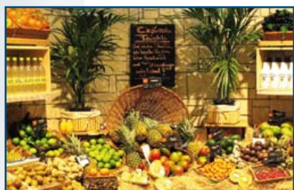
famila Center Karlsruhe