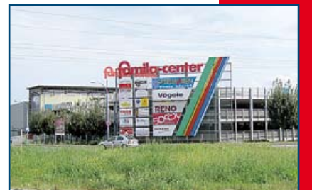
famila Center Rheinfelden