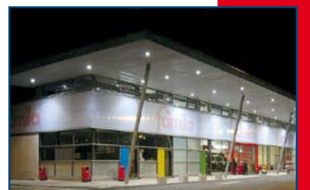
famila Center Waldshut