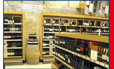
Weinkontor Pforzheim West