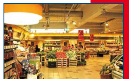
famila Center Waldshut