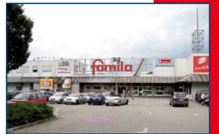
famila Center Pforzheim Ost