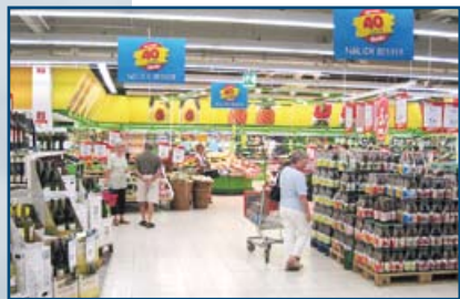
famila Center Frankenthal