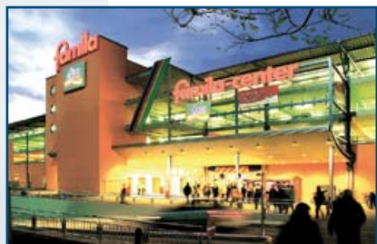
famila Center Karlsruhe