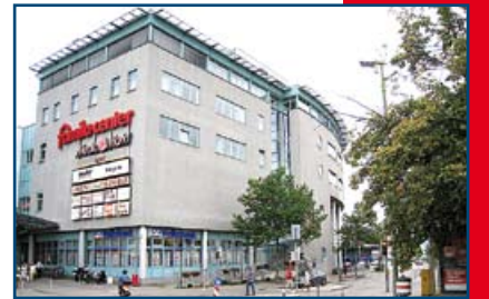
famila Center Pforzheim West