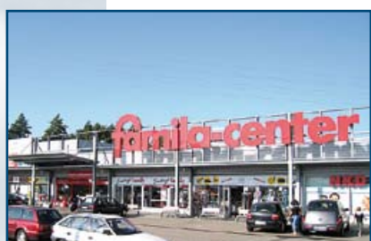
famila Center Östringen