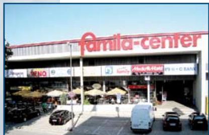
famila Center Heidelberg