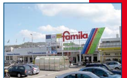
famila Mult Zentrum Weinheim