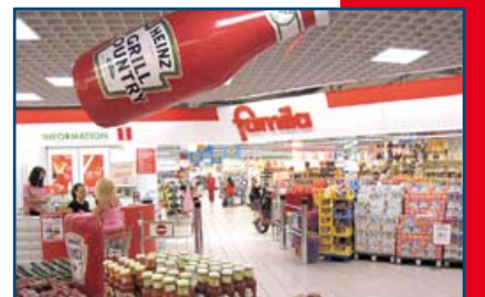
famila Center Rheinfelden