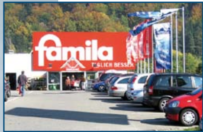
famila Center Albstadt