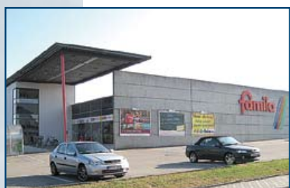
famila Center, Bad Schönborn